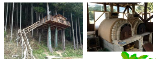
▲ツリーハウスや釜は大人気！