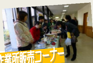
作業所販売コーナー